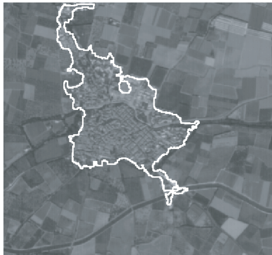
Extraction de zones urbaines, simulation SPOT5 (5M) Urban area extraction, SPOT5 simulation (5M)

This project aims to use theoretical models, both stochastic and deterministic, to tackle inverse problems related to Earth observation and cartography. In image processing various problems related to Earth observation are inverse problems. They are ill posed, as defined by Hadamard. Actually, even in favorable cases (for which a solution exists and is unique) problems remain, that are linked to the instability of the solution due to the noise during the observations. The goal is thus to regularize the solution with a priori constraints on the object.