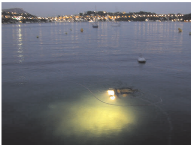
Le ROV Phantom en opération à Villefranche-sur-Mer A Phantom ROV in operation at Villefranche-sur-Mer

T raitement du Signal : construction, à partir des données provenant des capteurs du robot, d'une représentation simplifiée de l'espace de travail (problème de codage); évaluation constante et correcte de l'autonomie du robot (caractérisation d'incertitude); utilisation efficace des informations acquises (problème de fusion de données, filtrage).